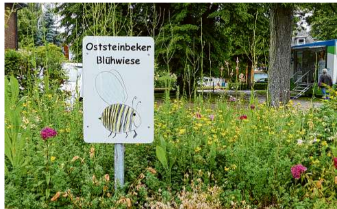
Auch vor dem Rathaus leuchtet ein Blütenmeer

den. Das Gärtnern macht nicht nur viel Spaß und ist wichtig für die Insekten, sondern auch das Ergebnis macht Freude: Kunterbunte Blütenmeere leuchten. Auf die Gewinner warten Geldpreise bis zu 400 Euro. Alle Infos dazu unter www.wir-tun-was-fuer-bienen.de . (sr)